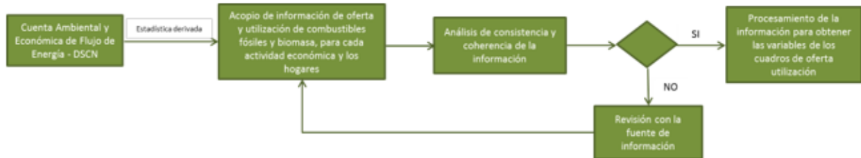
Diagrama 1. Proceso de validación de la fuente de información

Se diseñan las actividades que permiten revisar y validar el archivo de datos que se conforma a partir del acopio de información para la CAEFM-EA, considerando que, en caso de ser requerido, se puedan realizar consultas a la fuente de datos, para garantizar el rigor estadístico en el procesamiento de la información.