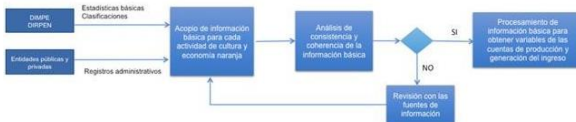
Diagrama 1. Proceso de validación de las fuentes de información