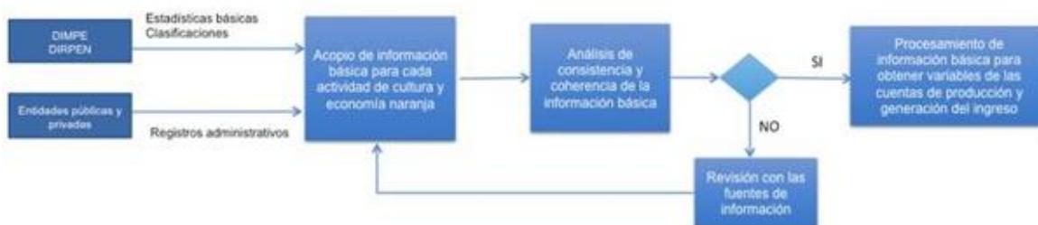
Diagrama 1. Proceso de validación de las fuentes de información

El diagrama 1 representa secuencialmente el proceso de validación de las fuentes de información antes de iniciar el método de cálculo.