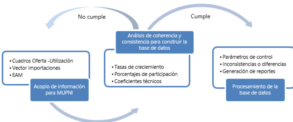
Diagrama 1. Procedimiento de validación de las fuentes de información

Las diferentes copias de seguridad de los códigos permiten a cualquier usuario de software libre ya sea R o Python, replicar los cálculos inmediatamente. En caso de que se presenten inconvenientes con la información o replanteamientos en los insumos presentados, estos códigos permiten tener la disponibilidad del cálculo tal cual se ha realizado en entregas y publicaciones previas, sujetas a la disponibilidad de información del año que se desee realizar. Finalmente, para la MUPNI no se realiza imputación de datos, pero realizan los procesos de validación y consistencia de la información básica.